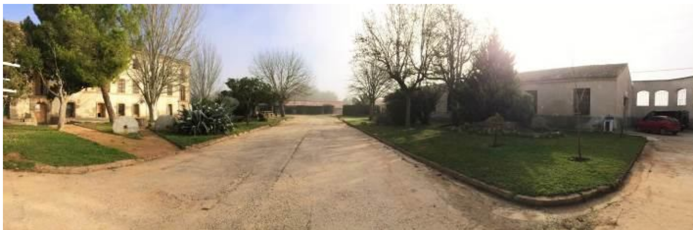
Aspecto actual de los jardines de La Obra.

Y esto no termina aquí. Ya estamos planificando una primavera que se presenta con mucha actividad, no sólo por el cultivo de la flor y de los productos de huerta propios de esta estación sino también por la realización de las prácticas de empresa, que comenzarán previsiblemente en el mes de mayo.