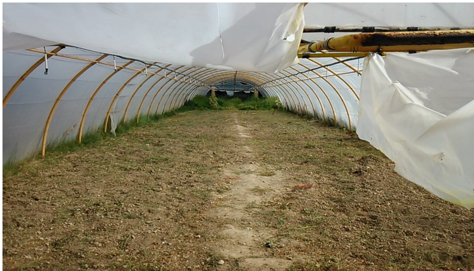
Proceso de adecuación del invernadero de túnel para producción hortícola.

- Actividades en invernadero túnel para producción de verduras. Las actividades de cultivo hortícola dentro del invernadero túnel han consistido en la eliminación de las plantas de temporadas anteriores adecuación del terreno con el empleo de motohazadas, plantación de diversas especies de invierno (borraja, lechuga, de tres variedades, acelga, rábanos, rabanitos y cogollos).