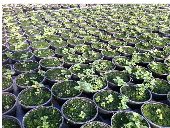
Producción de flor y plantas aromáticas en semillero dentro del invernadero multicapilla.