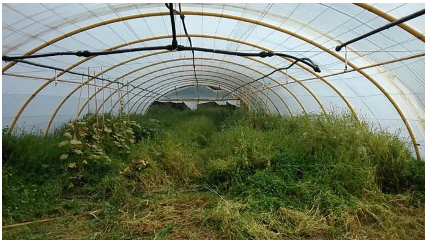
Estado inicial del invernadero de túnel para producción hortícola.

La llegada a las instalaciones de la Obra de la Mejana fue un poco desoladora. Tras varios meses de inactividad veraniega en La Obra, los jardines de este centro educativo presentaban una vegetación exuberante, descontrolada y desordenada. Abrir el invernadero fue casi como entrar por la puerta de la selva amazónica.