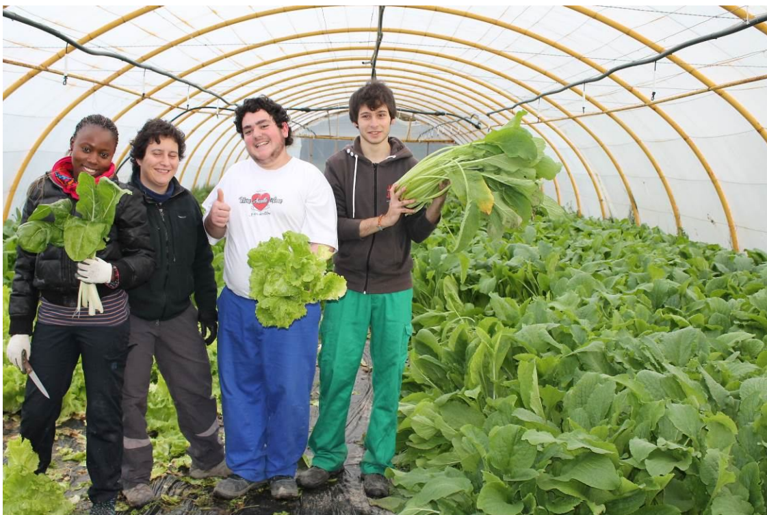
Recogiendo acelga, lechuga y borraja.