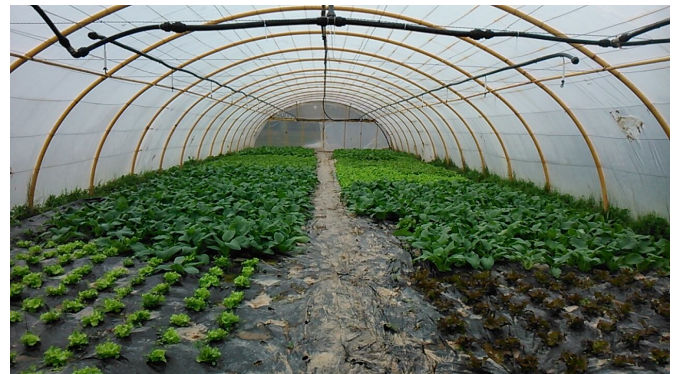
Plantación de verdura en invernadero de túnel.