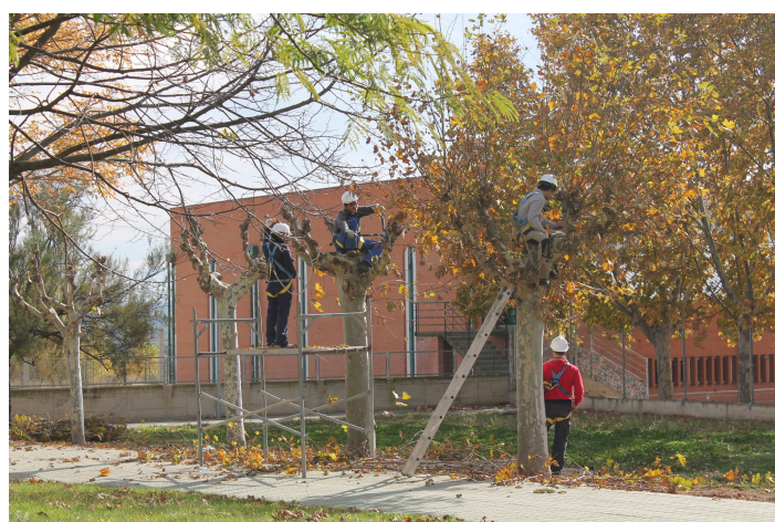
Labores de cortado de césped en la Obra y poda en la ETI CENTRAL.

- Actividades de producción de flor en semillero. En primer lugar se han adecuado los espacios del invernadero multicapilla y se han puesto en orden los sistemas de riego automático así como las mesas de semillero para con posterioridad preparar las macetas y los semilleros con plantas aromáticas como la menta, o perejil, y con flores como la vinca, caléndula y pensamiento y hortalizas como recula, canónigo